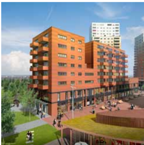
Artist impression van de nieuwbouw